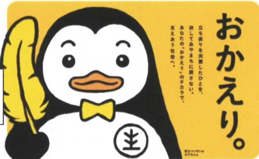
犯罪や非行を防止し、更生を促す社会を明るくする運動