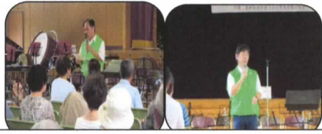
講演 「社会を明るくする運動について」 「更生保護及び執行猶予一部改正について」