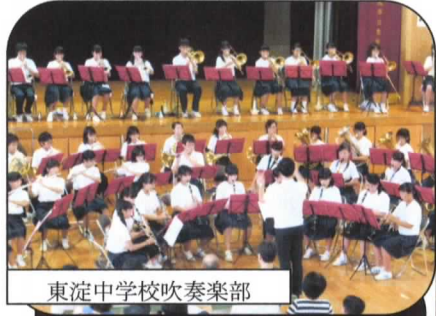
東淀中学校吹奏楽部