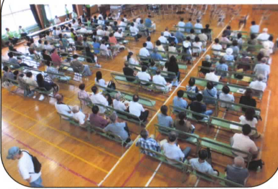
参加者数296名、愛の募金31,662円

社会を明るくする運動とは・・・ すべての国民が犯罪や非行の防止と罪を犯した人たちの更生について理解を深め、それぞれの立場において力を合わせ、犯罪のない地域社会を築こうとする全国的な運動で、今年で66回目を迎えます。更生保護とは・・・ 犯してしまった罪をつぐない、社会の一員として立ち直ろうとするには、本人の強い意志や行政機関の働きのみならず、地域社会の理解と協力が不可欠です。我が国では、保護司、更生保護施設を始めとする更生保護ボランティアと呼ばれる人たちの他、更生保護への理解と協力の下、関係機関・団体との幅広い連携によって更生保護は推進されています。