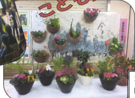
作品展示 (寄せ植え)