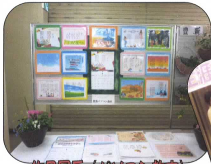
作品展示 (パソコン教室)